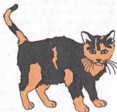
Рис. 41. Черепаховая окраска кошки

полов составляет 1:1, что и совпадает с фактически наблюдаемым. Сходный способ определения полов присущ многим животным, всем млекопитающим, в том числе и человеку. У некоторых животных и у растений пол особи определяется другими способами.